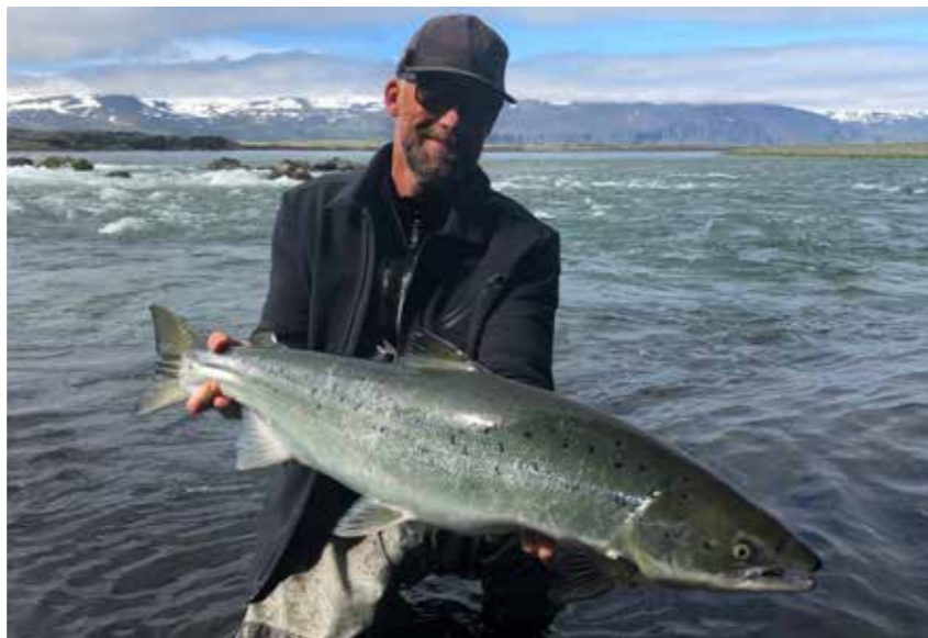
Þeir eru ekki allir 100 sm! Þessi gullfallegi fiskur var veiðimanninum mikil blessun.

Í stórrí á eins og Laxá í Aðaldal veiðum við með tvíhendum og skiptir oftast ekki jafnmiklu máli þótt maður sletti dálítið með línunni. En það má alls ekki gera í minni ám eins og Miðfjarðará eða Fitjaá. Lemji maður vatnið og sletti með línunum í viðkvæmum ám er alveg hægt að gleyma því að fá eitthvað. Nú orðið kemur fólk í Aðaldalinn með línur sem eru ætlaðar til að veiða stálhaua