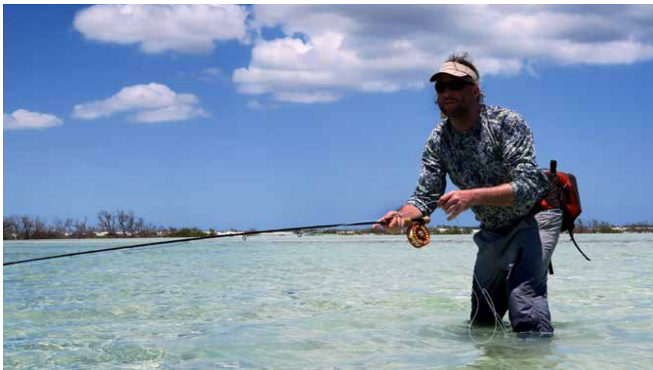
Læðst að silfurbokka á grunni við Bahamaeyjar. Öll veiði er sjónveiði.

allan heim og er með skrifstofu í Miami í Bandaríkjunum, Singapúr, Dóminíkanska lýðveldinu og nærri Sjanghæ í Kína. Maður vinnur mikið í gegnum tölvuna og tekur fjarfundi: Kína á morgnana, Evrópa um miðjan daginn og USA á kvöldin. Stundum er hægt að taka þessa fjarfundi af árbakkanum. Ég hef smám saman þurft að læra að vera góður stjórnandi og kaupsýslumaður en ég lifi fyrst og fremst fyrir hönnunina. Ég vil vera frumlegur í öllu sem ég geri því að það veitir enga ánægju að stæla það sem aðrir hafa gert, fyrir utan að það er ólöglegt. Ég hef unun af því að búa til sögur í kringum vöruna, auglýsa og markaðssetja.“