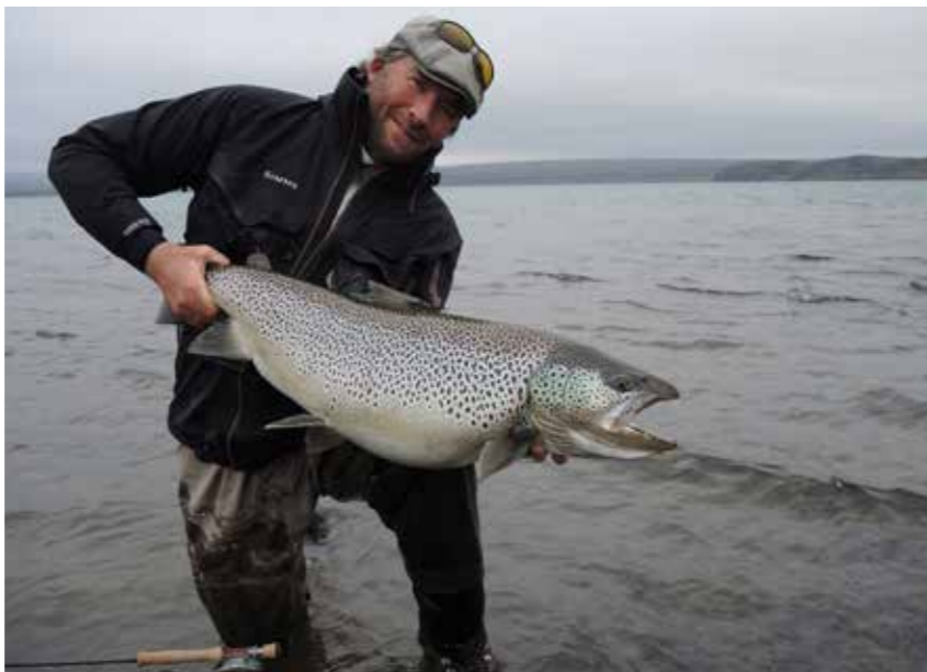
Hugsanlega stærsti urriðinn sem veiðst hefur á Þingvöllum á síðari tímum. Viðmiðunartöflur segja að hann hafi verið 16–16,8 kg. Fluguveiddur á ION-svæðinu sumarið 2015.